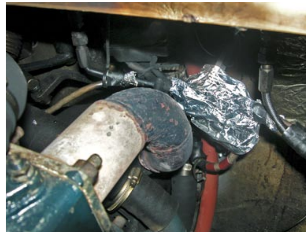
Det okylda avgasröret, staniolpapper och brännmärken i däcksbalken.

DENNA GÅNG PÅ EN Iveco dieselmotor samt ett tjugo år gammalt besiktningsprotokoll från Biskopsuddens Marina där det är ett stort kryss i rutan för "Varvsbyggd".