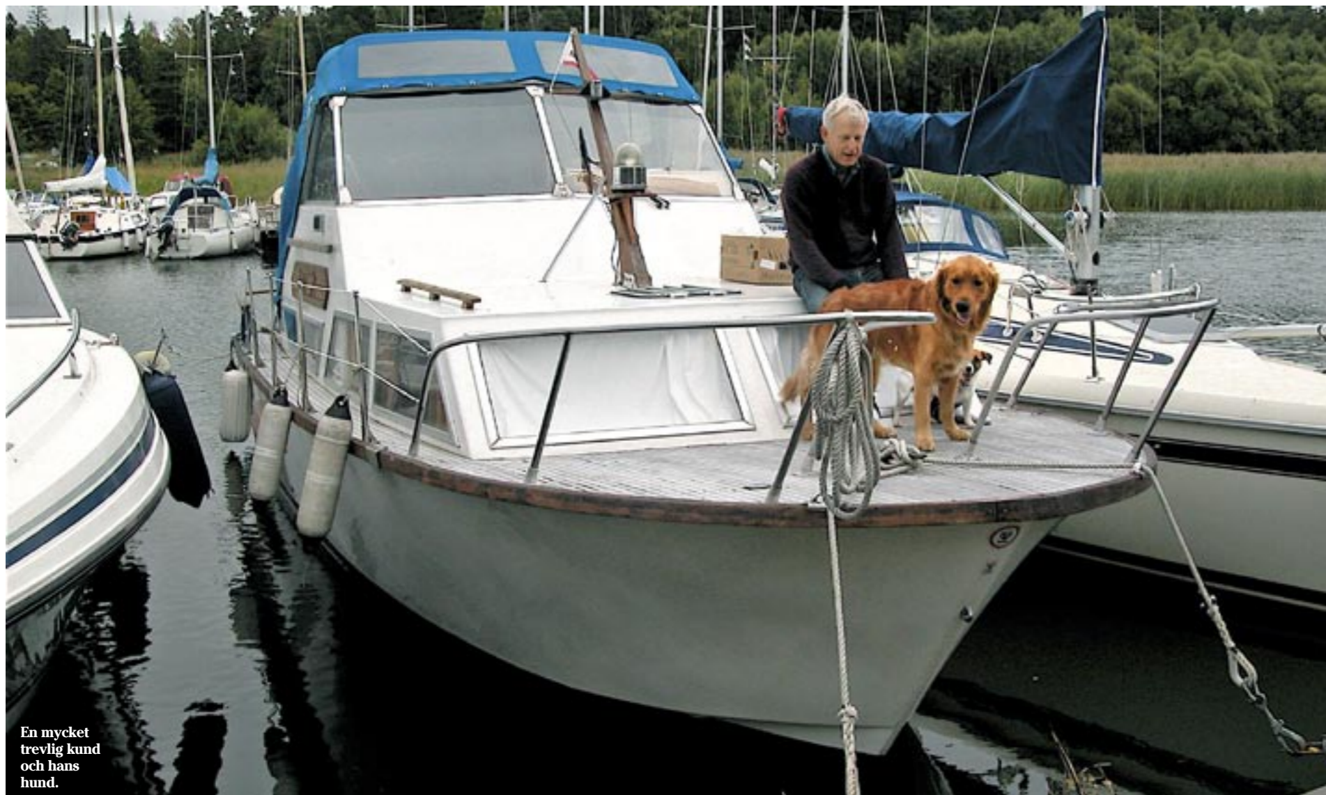
En mycket trevlig kund och hans hund.