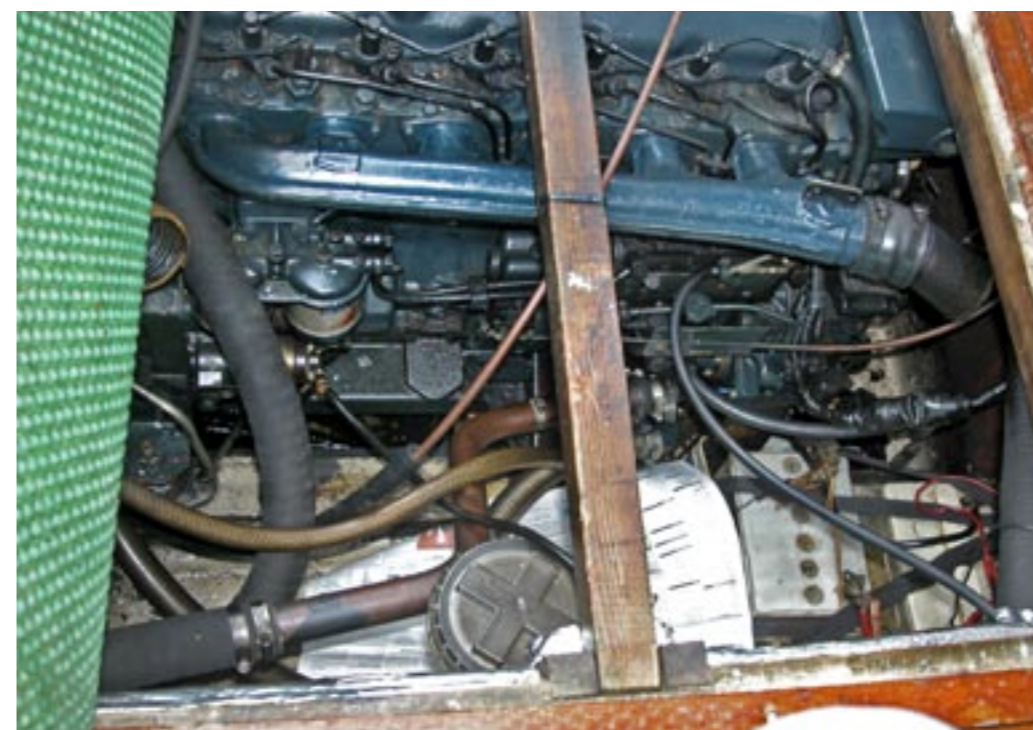
Mycket rör och ledningar av alla de slag, och en DN att stå på.