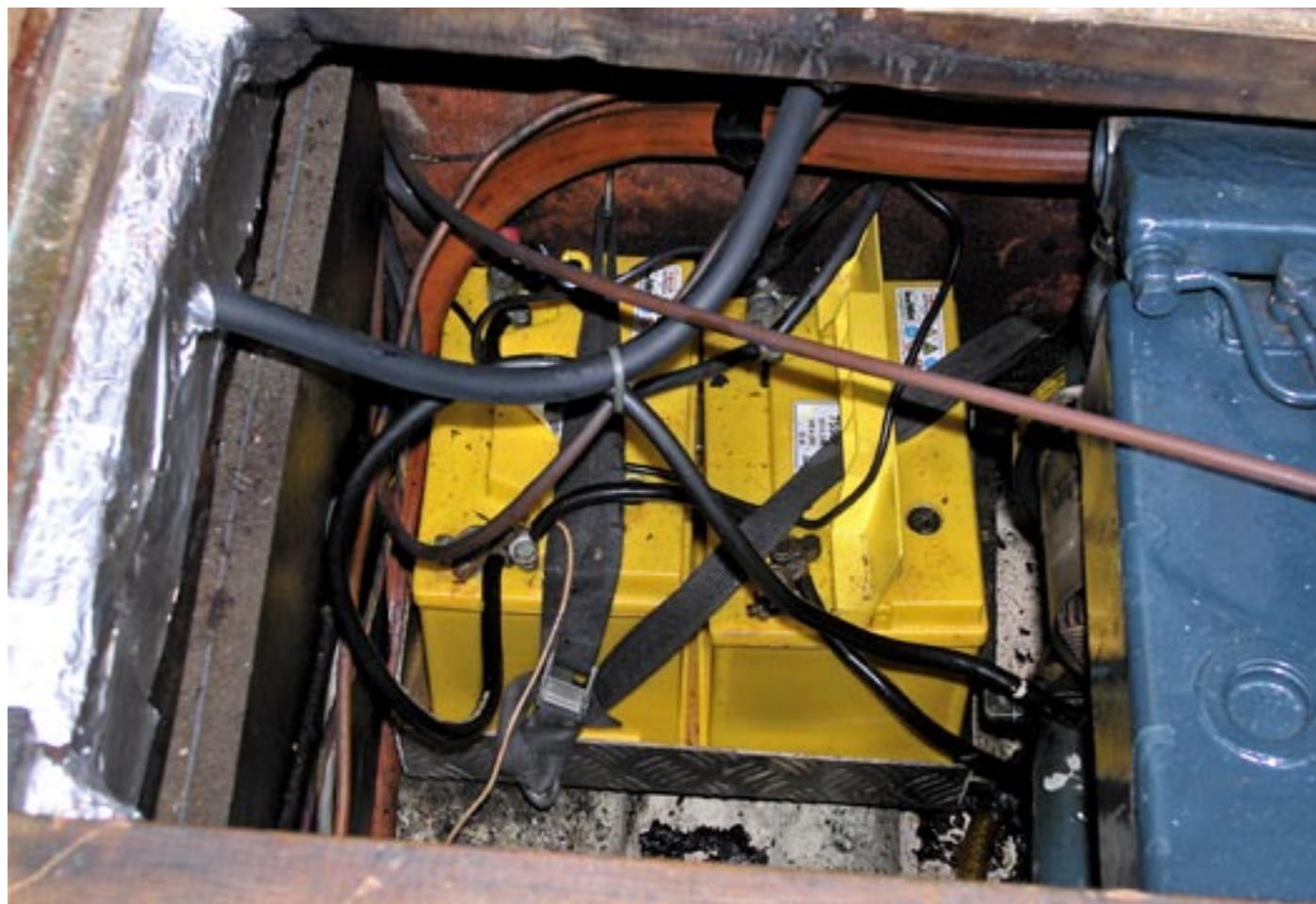
Ena batterigruppen med bara minuskablar, att döma av färgen, blandat med lite trädgårdsslang och rörledning i koppar.

► toret har en text på väggen skriven av den danske filosofen Sören Kierkegaard som är mycket tänkvärd. Texten börjar med: