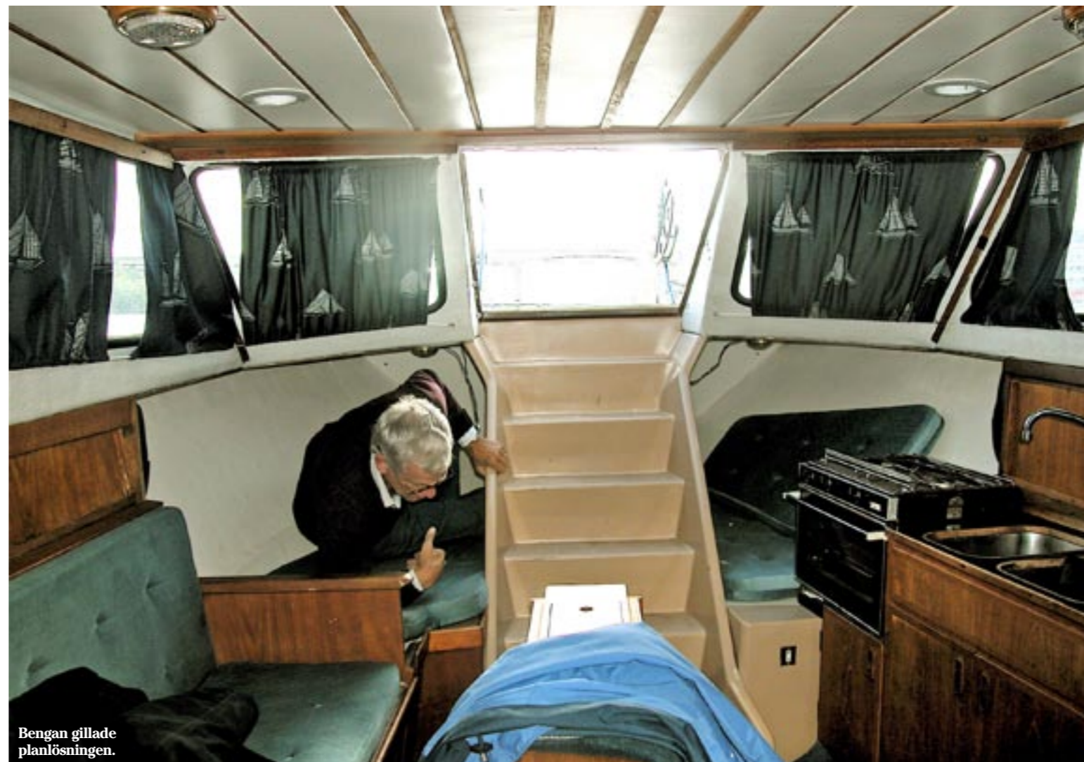
Bengan gillade planlösningen.