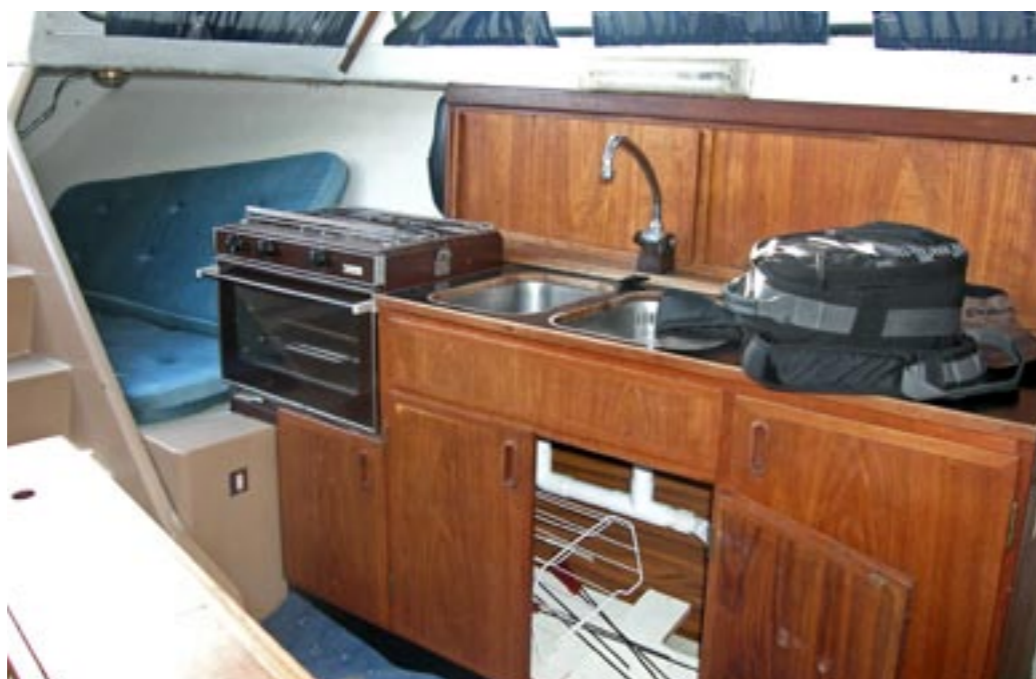
Hur kommer man in i styrbordschojen?