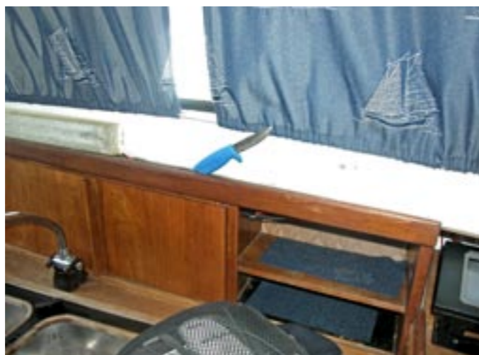
Hela pentrymodulen är lös. Notera knivskaftet.