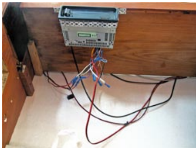
En liten del av "elsystemet".

– Javisst är motorn snygg och låter bra, men kolla här på